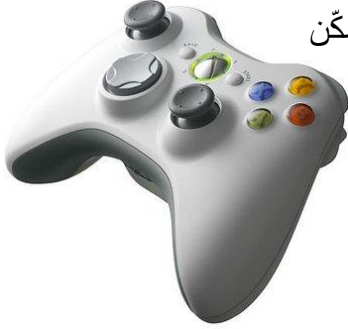
عصا التحكم اللاسلكية