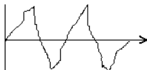
Le son .....

numérique - la fréquence - la capacité - analogique - échantillonnage - une vibration - l'ordinateur - le timbre